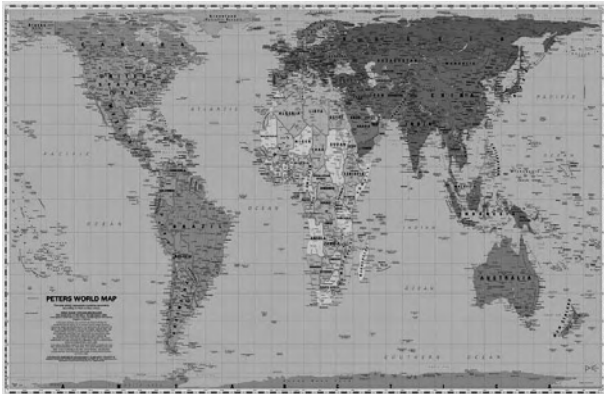
Karte 1: Peters-Projektion

Zwei mögliche Lösungswege kann man hier sehen: