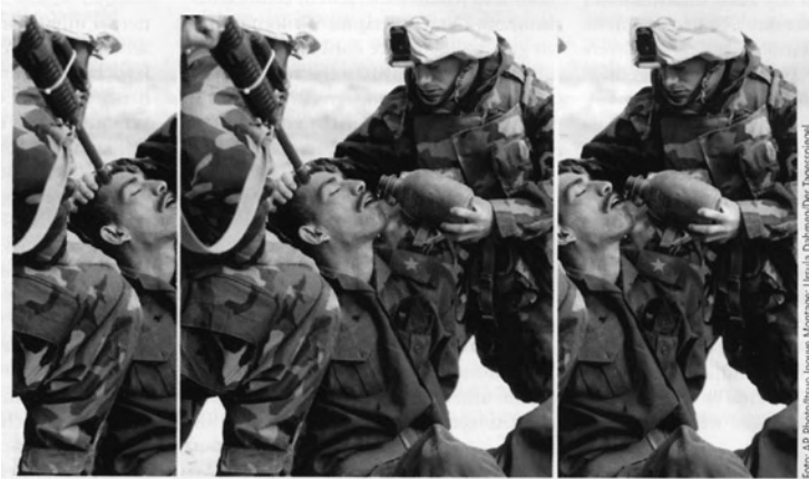
Das Bild zeigt einen irakischen Soldaten umgeben von amerikanischen Soldaten, im Irak-Krieg 2003. Die Bildausschnitte links und rechts lassen völlig unterschiedliche Interpretationen der fotografierten Situation zu.